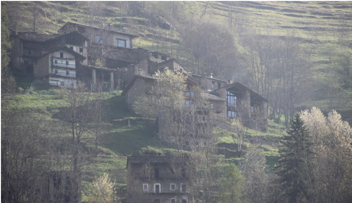
Renovation alter Steinhäuser in italienischen Alpen, CA22.

Auf der Suche nach alpinen Architekturen im Wandel